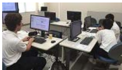
昨年度の研究風景