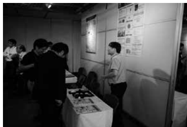
産学連携研究発表会

研究シーズ集の作成、産学連携研究発表会（産学官連携イベント）の開催等を通じて、学外に情報を発信しています。