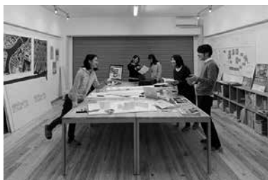
基町プロジェクト活動拠点施設「M98」

教員が企業や行政等と実施する共同研究、企業や行政等からの依頼により実施する受託研究について窓口となり、事務手続き等の支援を行います。