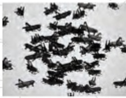
安村日菜子 Anti revolution 2022