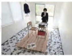
山下菜 美術をもう一度好きになるための視点 2022