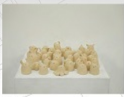
遠山雅 へんないまものたち 2021