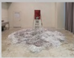
尚子 海 2021