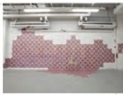
三好美紗 第一と複製 2021