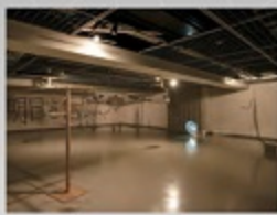
黒崎尚子 Skulpture (Desired one) 2021

それぞれの参加作家は、千田町との関わりから作品を制作し、個々のイメージの集合として、展示空間に千田町のビジョンを投影します。このビジョンが千田町の客観的なリアルを反映すると同時に、町の未来を想像するための足がかりとなれば幸いです。