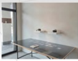
長谷川遥乃 You were here 2021